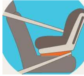
Лицом против движения